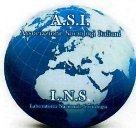
Associazione Sociologi Italiani